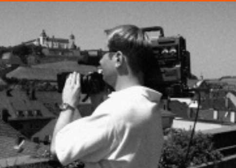
Pflege heute – Ausgangslage

Im Bereich der pflegerischen Dienstleistung zeigen sich in den letzten Jahren grundlegende Veränderungen. Die Aufgaben der Pflege werden in einem sozialpolitisch, rechtlich und wirtschaftlich schwierigen Versorgungsbereich zunehmend komplexer. Immer stärker wirken sich hier die Einflüsse der demographischen Entwicklung, des soziologischen Strukturwandels und des medizinischen Fortschrittes auf das Marktgeschehen im Bereich sozialer Dienstleistungen, auf die Kostenträger, die Tarifpartner und nicht zuletzt auch auf die zu pflegenden Patienten aus.